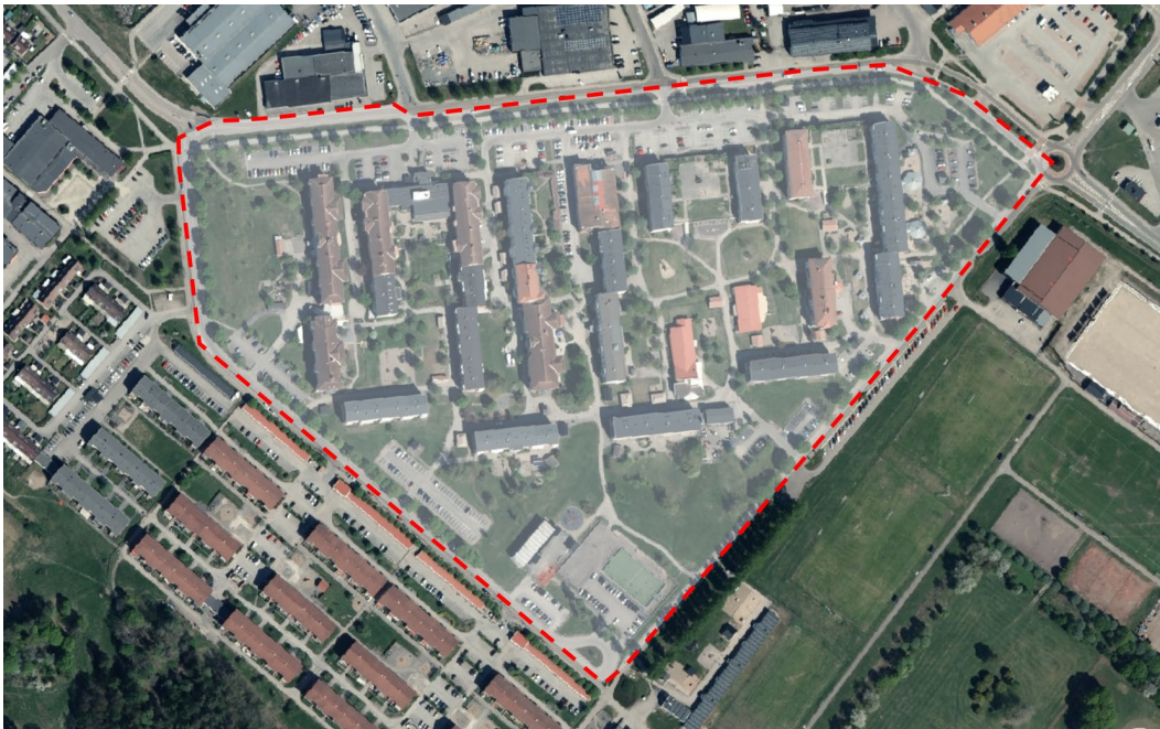
Flygfoto med planområdet markerat.

Kommunen arbetar med att ta fram en ny detaljplan som omfattar bostadsområdet Nygård. Syftet med detaljplanen är i linje med det som finns idag – bostäder med inslag av vård- och skolverksamhet samt kontor. Även framtida behov och möjlighet till utveckling ses över. Förslaget till detaljplanen är utställt på samråd mellan den 6 maj 2024 och den 3 juni 2024.